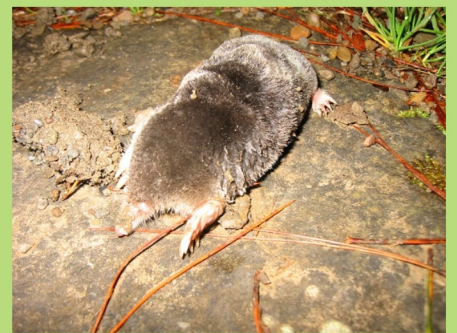
鹿野氏鼫鼠 Mogera kanoana